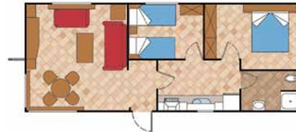
Aitana 10.000 AL 2D CC

Medidas Totales Largo: 8,50 m Ancho: 4,30 m