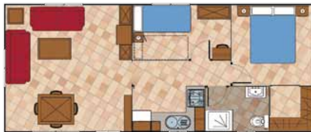
Aitana 11.000 2D CC Prestige

Medidas Totales Largo: 8,83 m Ancho: 4,00 m