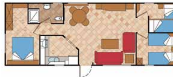
Aitana 11.000 AL 3D

Medidas Totales Largo: 9,20 m Ancho: 4,00 m