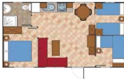
Aitana 8.000 C

Medidas Totales Largo: 7,15 m Ancho: 4,30 m