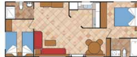
Aitana 10.000 VIP

Medidas Totales Largo: 11,36 m Ancho: 4,00 m