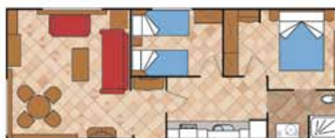
Aitana 11.000 A SL 2D N1

Medidas Totales Largo: 9,75 m Ancho: 4,00 m