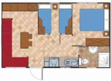
Aitana 6.700 STD

Medidas Totales Largo: 10,66 m Ancho: 4,00 m