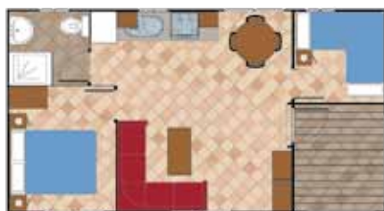
Aitana 8.000 B

Medidas Totales Largo: 11,36 m Ancho: 4,00 m