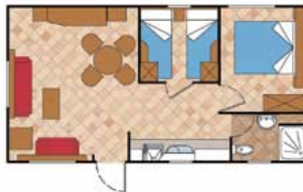
Aitana 8.000 AL

Medidas Totales Largo: 7,15 m Ancho: 4,00 m