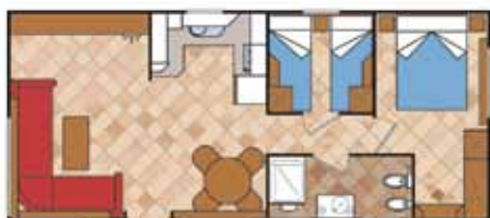
Aitana 9.500 A SL 2D

Medidas Totales Largo: 11,36 m Ancho: 4,00 m