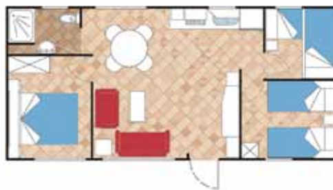
Aitana 9.000 AL

Medidas Totales Largo: 8,50 m Ancho: 4,30 m