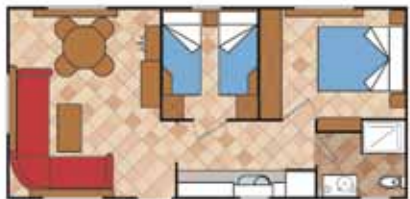
Aitana 8.500 A SL 2D

Medidas Totales Largo: 8,83 m Ancho: 4,00 m