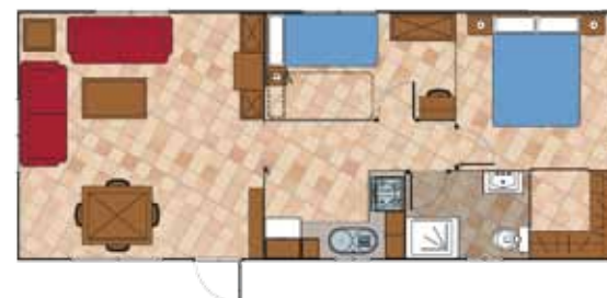
Aitana 10.000 2D CC Prestige

Medidas Totales Largo: 8,50 m Ancho: 4,00 m