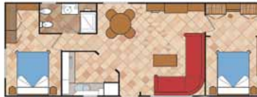
Aitana 11.000 A SL 2D CC N2

Medidas Totales Largo: 10,66 m Ancho: 4,00 m