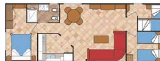
Aitana 11.000 A SL 3D CC N4

Medidas Totales Largo: 11,36 m Ancho: 4,00 m