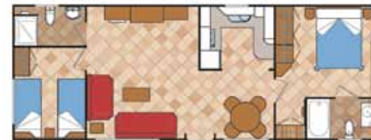
Aitana 11.000 A SL 2D SC N3

Medidas Totales Largo: 11,36 m Ancho: 4,30 m