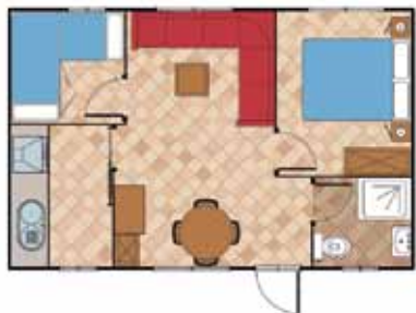
Aitana 6.700 AL 2D

Medidas Totales Largo: 7,15 m Ancho: 4,30 m