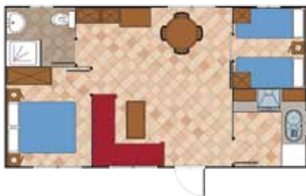
Aitana 8.000 A

Medidas Totales Largo: 10,50 m Ancho: 4,00 m