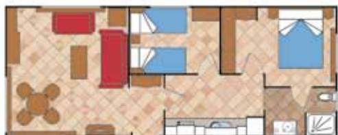
Aitana 10.000 A SL 2D CC

Medidas Totales Largo: 11,36 m Ancho: 4,00 m